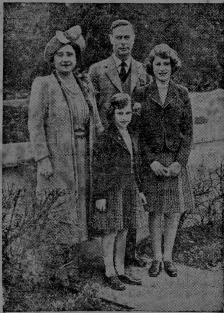
La Real Familia Inglesa, que sonriente ve ya su victoria.

Situada 150 varas al Sur de la Botica La Dolorosa Para la perfecta reparación de su auto o camión Calle Alfredo Volpe—Teléfono 4846