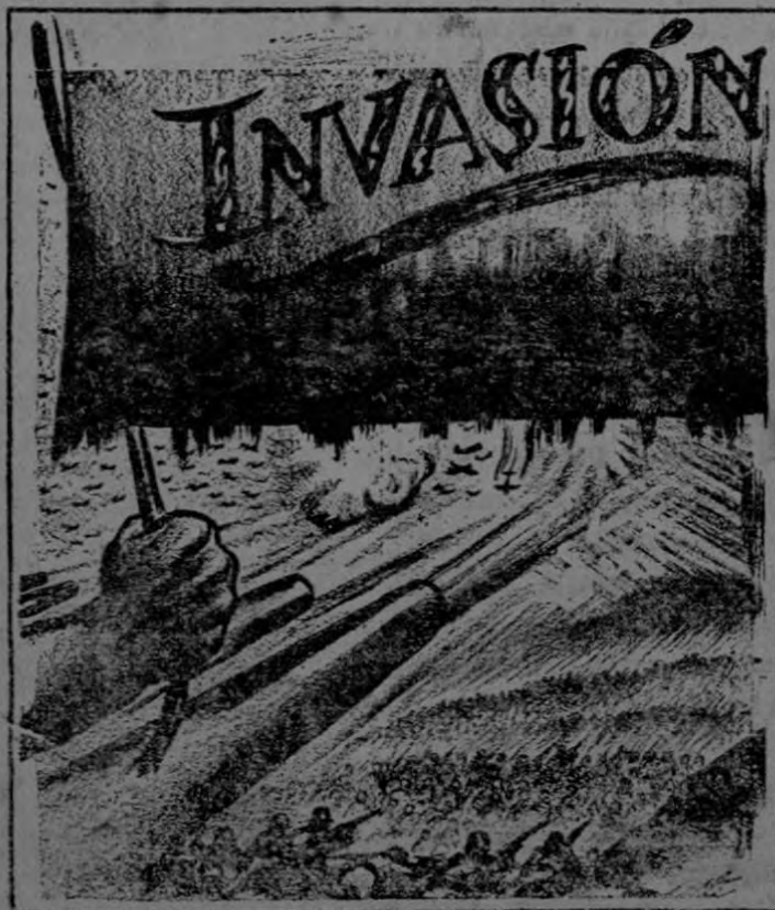
Heide en el