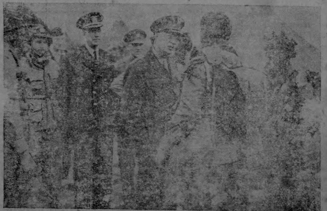
El general Eisenhower, Jefe Supremo de las Fuerzas Expedicionarias Aliadas aparece en el centro dando las últimas instrucciones a los paracaidistas estadounidenses antes de abordar los aviones que les condujeron a la Francia ocupada. Estas tropas desempeñaron un papel importante en las operaciones de desembarco. Esta fotografía fué transmitida por radio de Londres a Washington, el 6 de junio.