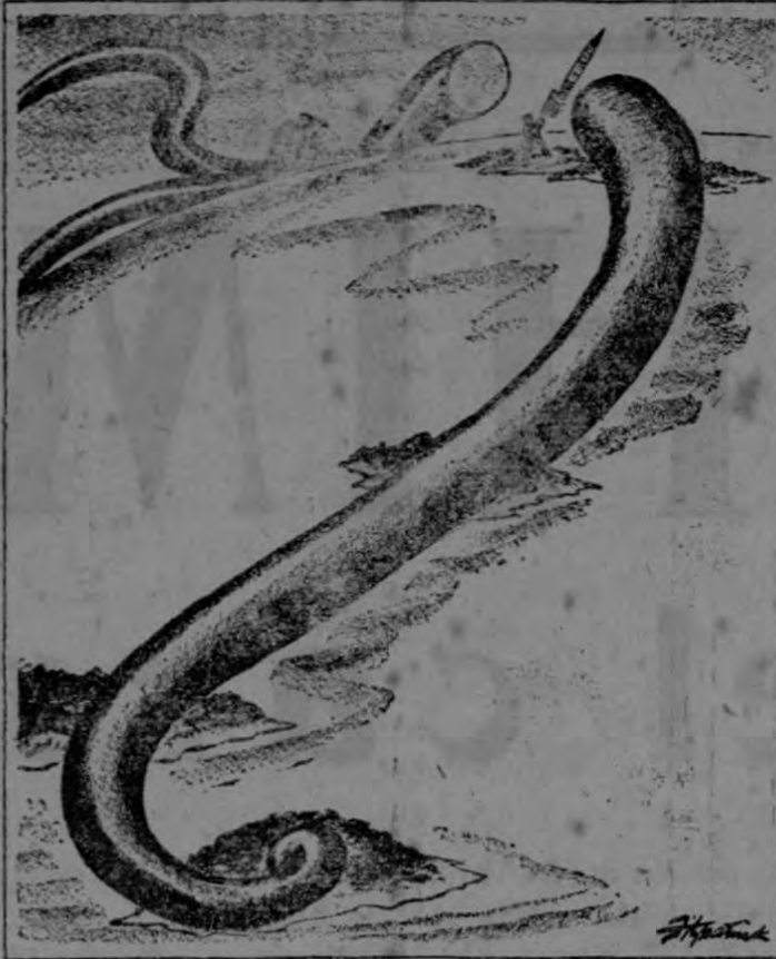
Fitzpatrick en el St. Louis Post-Dispatch.